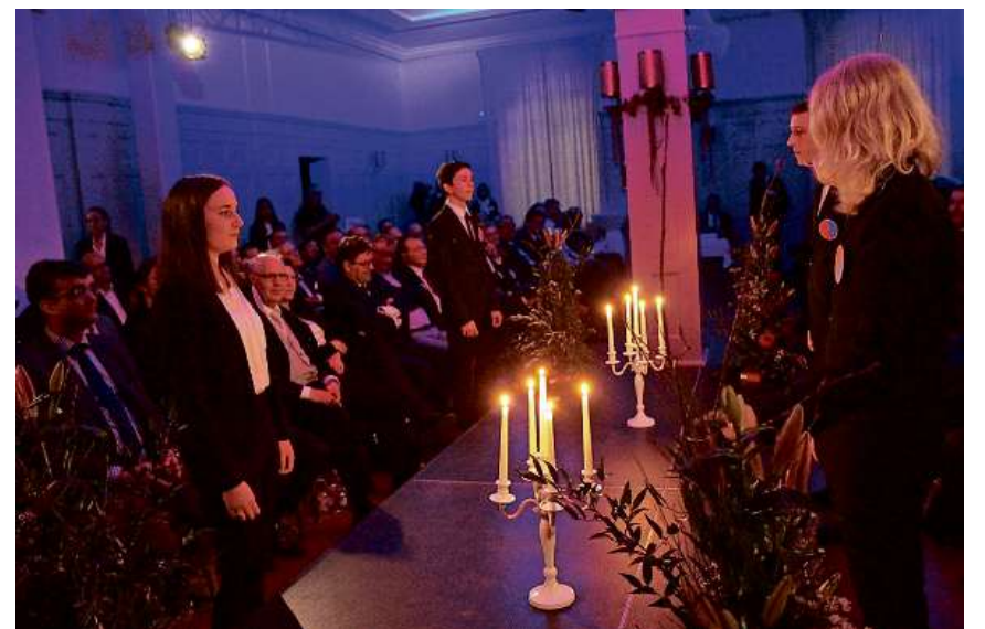
100 Jahre Hotellerie mit der Jugend wunderbar inszeniert.